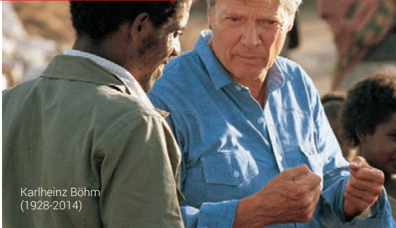
Karlheinz Böhms (1928-2014)

Im Geiste unseres Gründers, des Schauspielers Karlheinz Böhms, ist unsere Vision eine gerechte Welt, in der es die Spaltung in Arm und Reich nicht mehr gibt. In Äthiopien unterstützen wir die Ärmsten der Armen, ihre Zukunft aus eigener Kraft zu gestalten, damit sie in ihrer Heimat menschenwürdig leben können.