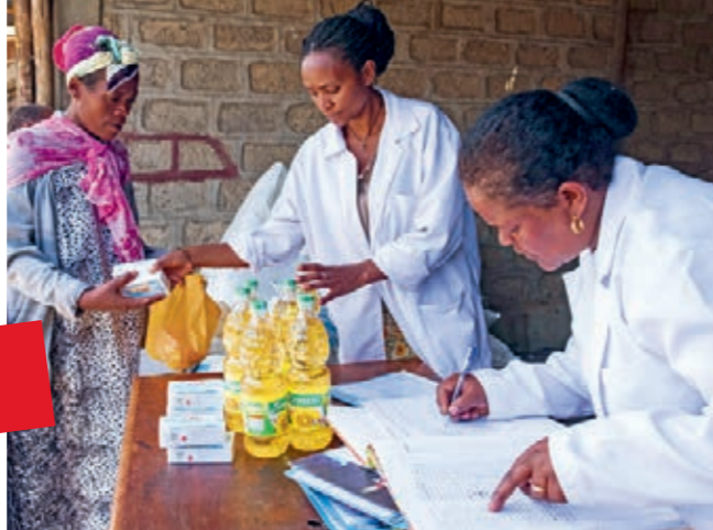
Ausgabe von Nahrungsmitteln