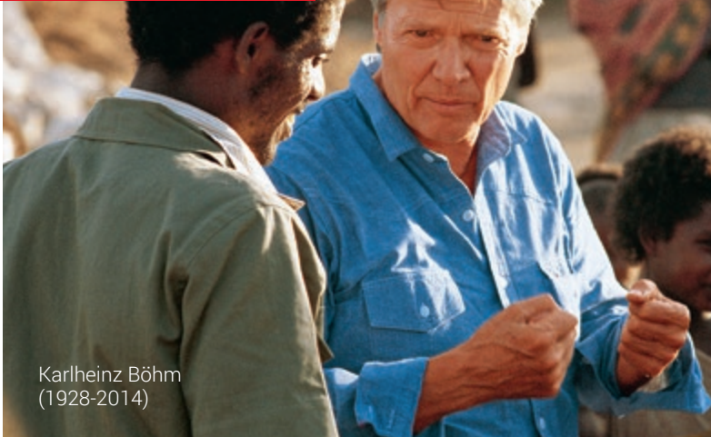
Karlheinz Böhm (1928-2014)

Im Geiste unseres Gründers, des Schauspielers Karlheinz Böhm, ist unsere Vision eine gerechte Welt, in der es die Spaltung in Arm und Reich nicht mehr gibt. In Äthiopien unterstützen wir die Ärmsten der Armen, ihre Zukunft aus eigener Kraft zu gestalten, damit sie in ihrer Heimat menschenwürdig leben können.