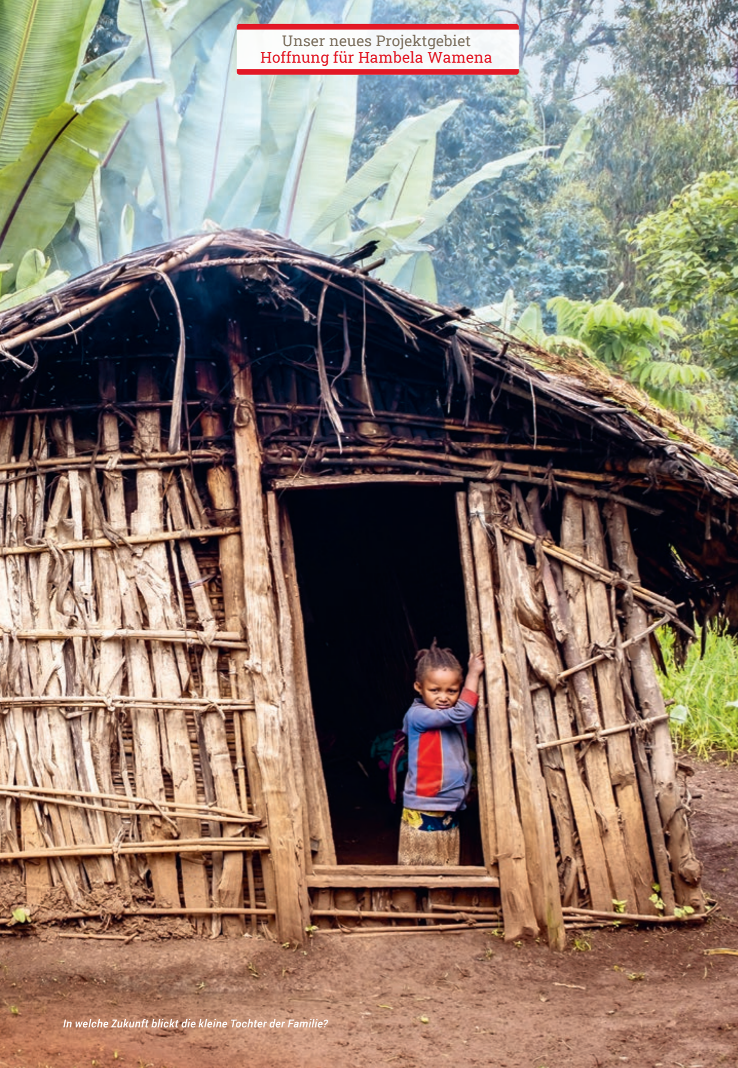
In welche Zukunft blickt die kleine Tochter der Familie?