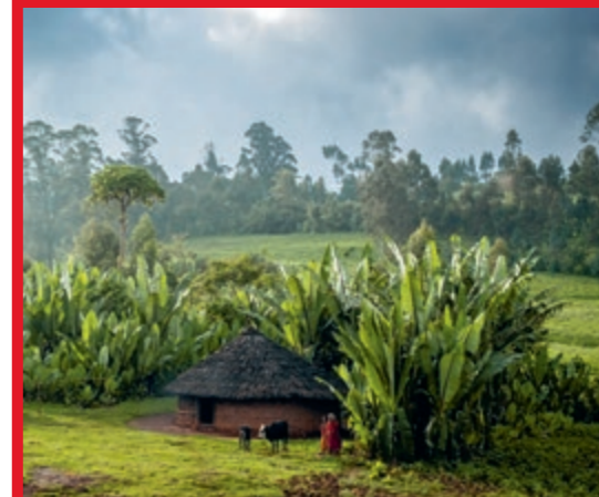
Bauernhof in Hambela Wamena

Bessere Ernten: Unsere Fachleute zeigen den Kleinbauern moderne und angepasste Bewirtschaftungsmethoden und wie sie ihre Ernten trotz kleiner Felder vergrössern und diversifizieren können, etwa mit proteinreichen Hülsenfrüchten.