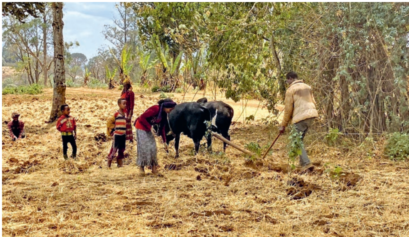
Pflügen in Hambela Wamena: Die Landwirtschaft muss ertragreicher werden

Langjährige Dürren und Konflikte sind dafür verantwortlich, dass die Preise für Nahrungsmittel weiter steigen. Darunter leiden besonders die ärmsten Familien. Wie geht es den Menschen an der Graswurzel? Und wie können wir positive Kontrapunkte für sie setzen? Das untersuchten wir in einer umfangreichen Baseline-Studie im Distrikt Hambela Wamena, unserem neuen Projektgebiet.