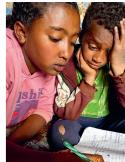
Bei den Hausaufgaben

kämpfen. So wurden die Bauarbeiten neuer Sozialwohnungen im zweiten Halbjahr verzögert, weil die Wasserversorgung oft tagelang unterbrochen war. Wenn Wasser verfügbar war, legten die Bauarbeiter Nachtschichten ein. Politische Unruhen führten dazu, dass die Regierung in der Hauptstadt einen Ausnahmezustand für die Region Amhara ausrief. Deshalb konnten viele Schulungen für die Eltern nicht durchgeführt werden. Die Sozialarbeiterinnen versuchten dies durch verstärkte Hausbesuche zu kompensieren.