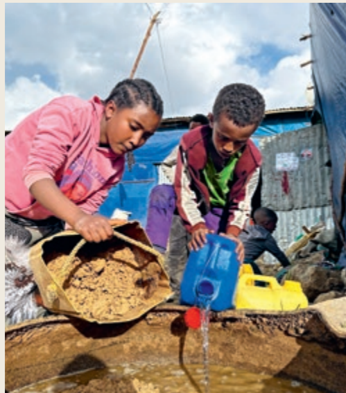
Debre Berhan: Kinder mischen Kraftfutter für die Milchkühe ihrer Familie an (Seite 14)