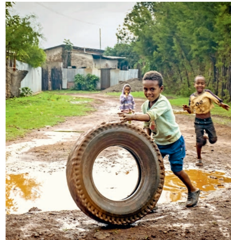
Entlegener Distrikt ohne Infrastruktur: Die meisten Strassen in Abaya sind Erdpisten