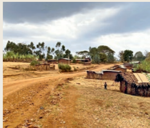
Der entlegene Bezirk Hambela Wamena ist unser neues Projektgebiet