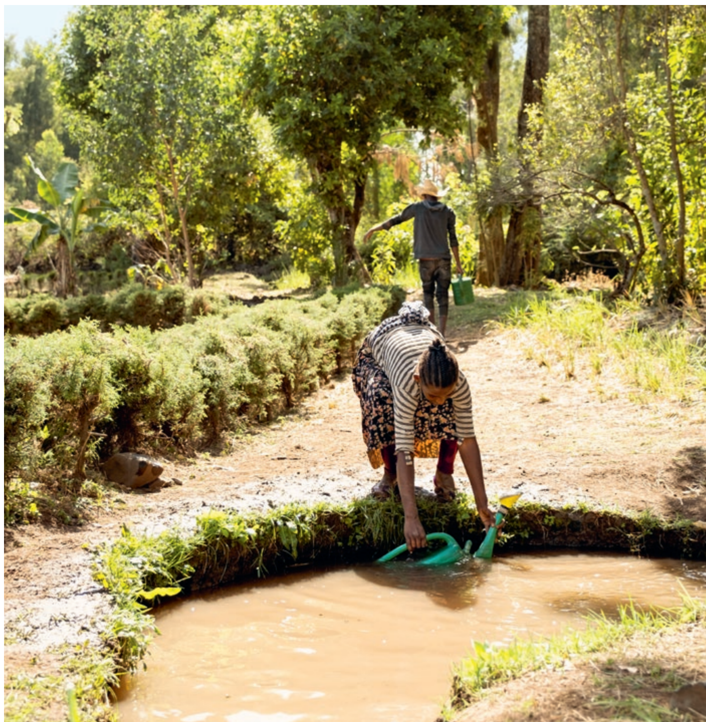
Die Pflänzlinge in unserer Baumschule in Fogera brauchen viel Hege und Pflege

Gerade die ärmsten Familien leiden 2024 weiter unter dem Klimawandel und der Inflation der Landeswährung Birr. Ethnische Spannungen hemmten im vergangenen Jahr die Projekte im Bundesstaat Amhara – in diesem Jahr wollen wir die verursachten Verzögerungen aufholen.