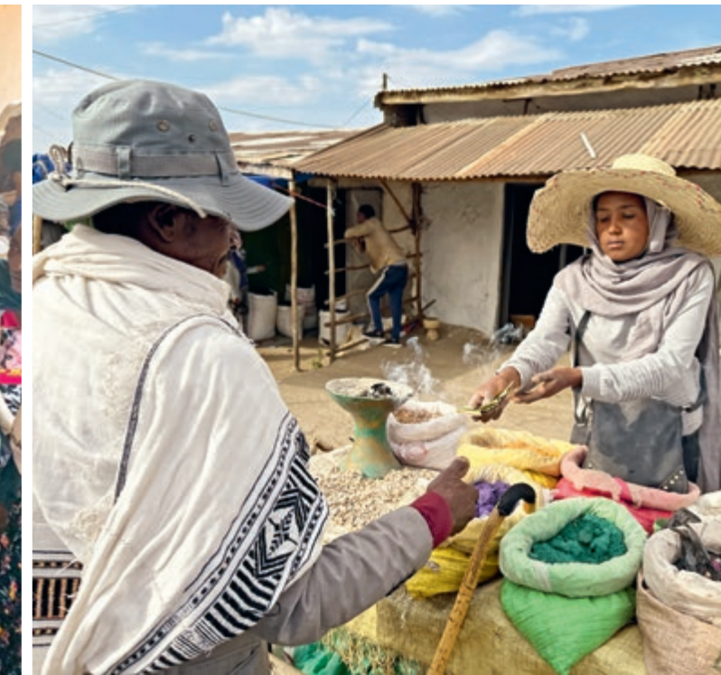
Wir bringen Frauen in Selbsthilfegruppen zusammen und befähigen sie, kleine Gewerbe zu beginnen – wie diesen Verkauf von Räucherwerk auf dem Markt von Debre Berhan

Bislang kamen die Menschen nur bei privaten Geldverleihern an Kredite zu Zinsen von 100 Prozent, was ihre Armut in die Zukunft fortschrieb. Unsere Fachleute helfen nun, in den Dörfern Spargruppen und Genossenschaften aufzubauen. So können die Familien Zwischenhändler umgehen und sich von den Wucherzinsen befreien. In diesen Zusammenschlüssen können die Fachleute auch Schulungen anbieten. Der Boden ist übernutzt und teils erodiert. Wir