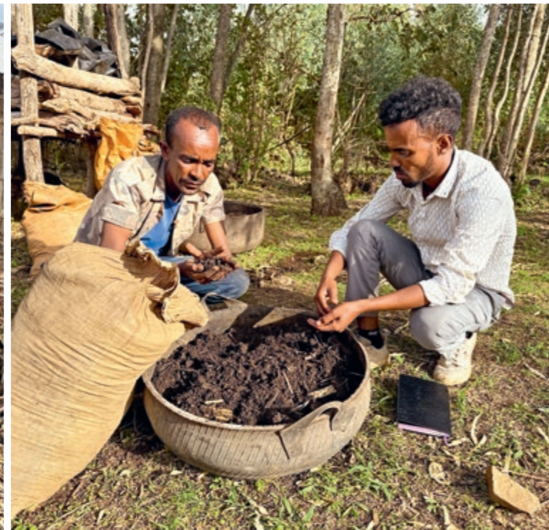
Einheimische Berater ziehen täglich von Hof zu Hof und zeigen den Familien, wie sie ihre Landwirtschaft ertragreicher machen können – zum Beispiel über die Herstellung von Kompost