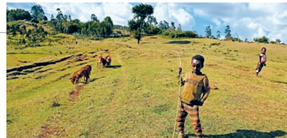
Vieh ist der wichtigste Besitz: Hirtenbub in unserem neuen Projektgebiet Hamela Wamena

Die zu langen Dürreperioden, vor allem im Süden, verringern die landwirtschaftliche Produktion, und aufgrund des Ukraine-Kriegs stockte 2022 der Getreideimport, was die Preise für Grundnahrungsmittel in die Höhe schnellen liess. Unter dem Krieg in Tigray litt die Wirtschaft, die bereits durch die Lockdowns in der Corona-Pandemie gebremst worden war. Hinzu kam, dass die äthiopische Regierung 2023 die hohen Subventionen für Benzin und Diesel kürzte. Der Treibstoffpreis verdoppelte sich innerhalb eines Jahres, damit schlugen auch die höheren Transportkosten auf die Lebens-