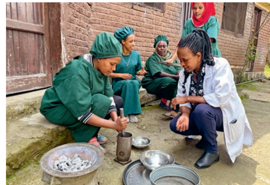
Hauswirtschaftsausbildung: Kaffeebohnen und Gewürze werden traditionell mit Hilfe von Mörsern zerdrückt.

Wir konzentrieren uns weiter auf Schulungen . 274 Lehrer bekommen Fortbildungen, unter anderem in Didaktik,