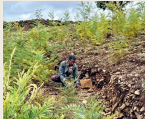
Fogera: Bäume pflanzen, Menschen schützen