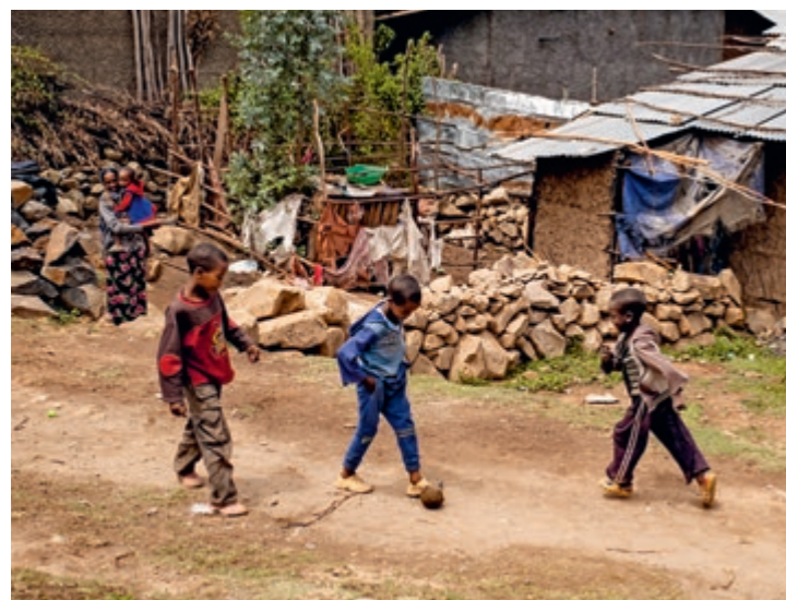
Während Gleichaltrige in der Schule sind, spielen die drei Brüder Fussball