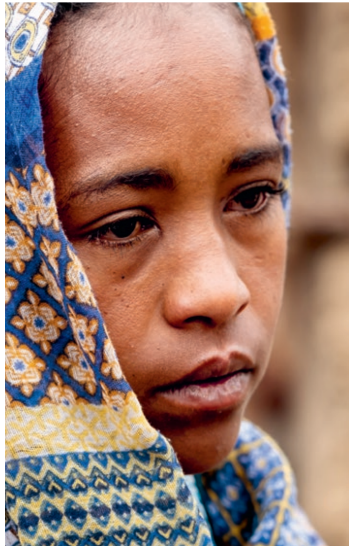
«Es gibt viel Liebe bei uns. Ohne Armut wären wir glücklich»