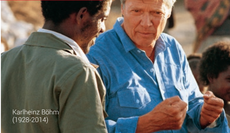
Karlheinz Böhm (1928-2014)

Im Geiste unseres Gründers, des Schauspielers Karlheinz Böhm, ist unsere Vision eine gerechte Welt, in der es die Spaltung in Arm und Reich nicht mehr gibt. In Äthiopien unterstützen wir die Ärmsten der Armen, ihre Zukunft aus eigener Kraft zu gestalten, damit sie in ihrer Heimat menschenwürdig leben können.