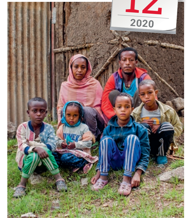
In der Corona-Krise: Der Familie ist nicht zum Lächeln zumute